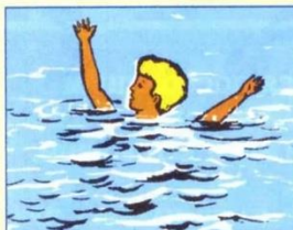
Не купайтесь в незнакомых местах и не заплывайте далеко от берега