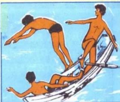
Не перегружайте плавательное средство и не прыгайте с него