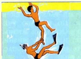
Не играйте в воде в опасные игры