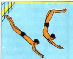
Не ныряйте в незнакомых местах