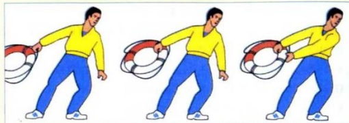
Способы подачи спасательного круга

Если утопающий находится недалеко от берега и способен к активным действиям, то ему необходимо бросить какое-либо СПАСАТЕЛЬНОЕ СРЕДСТВО .